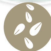
Granos de sésamo