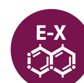
Dióxido de azufre y sulfitos