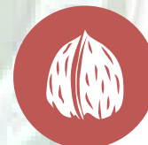
Frutos de cáscara