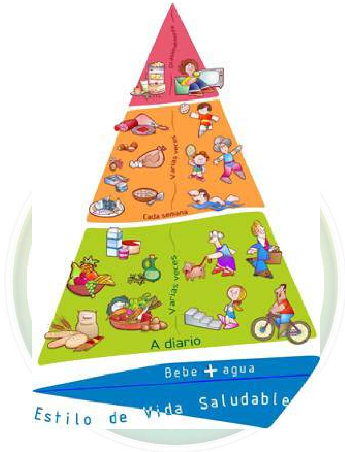
Pirámide NAOS 1