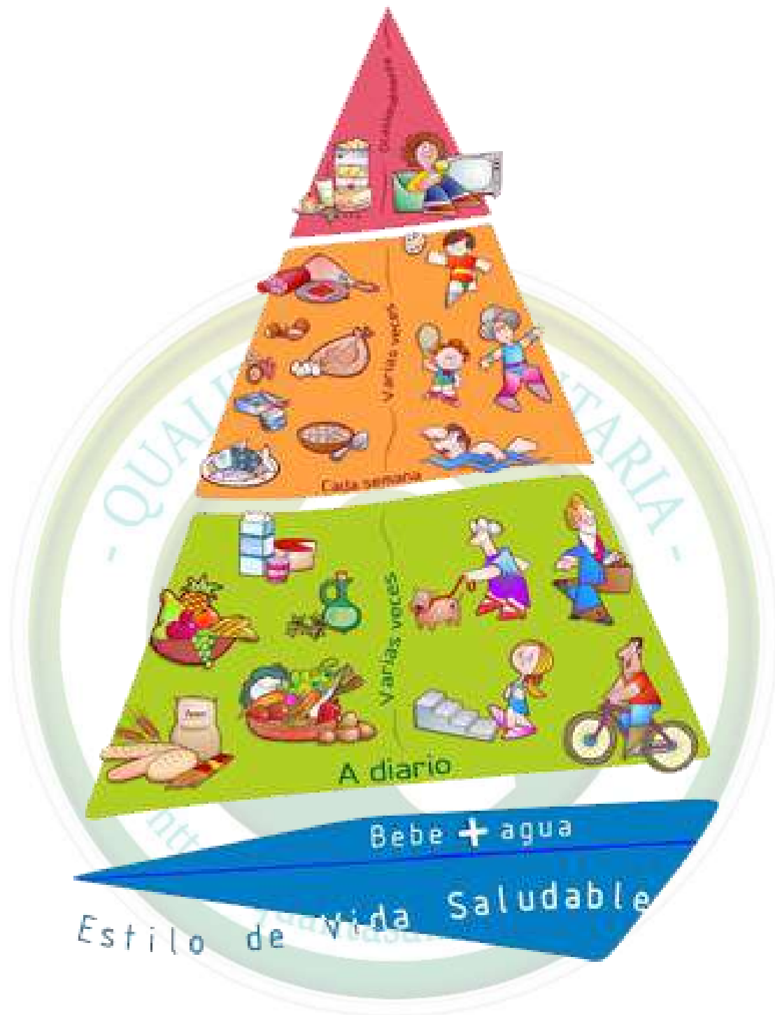
Pirámide NAOS 1