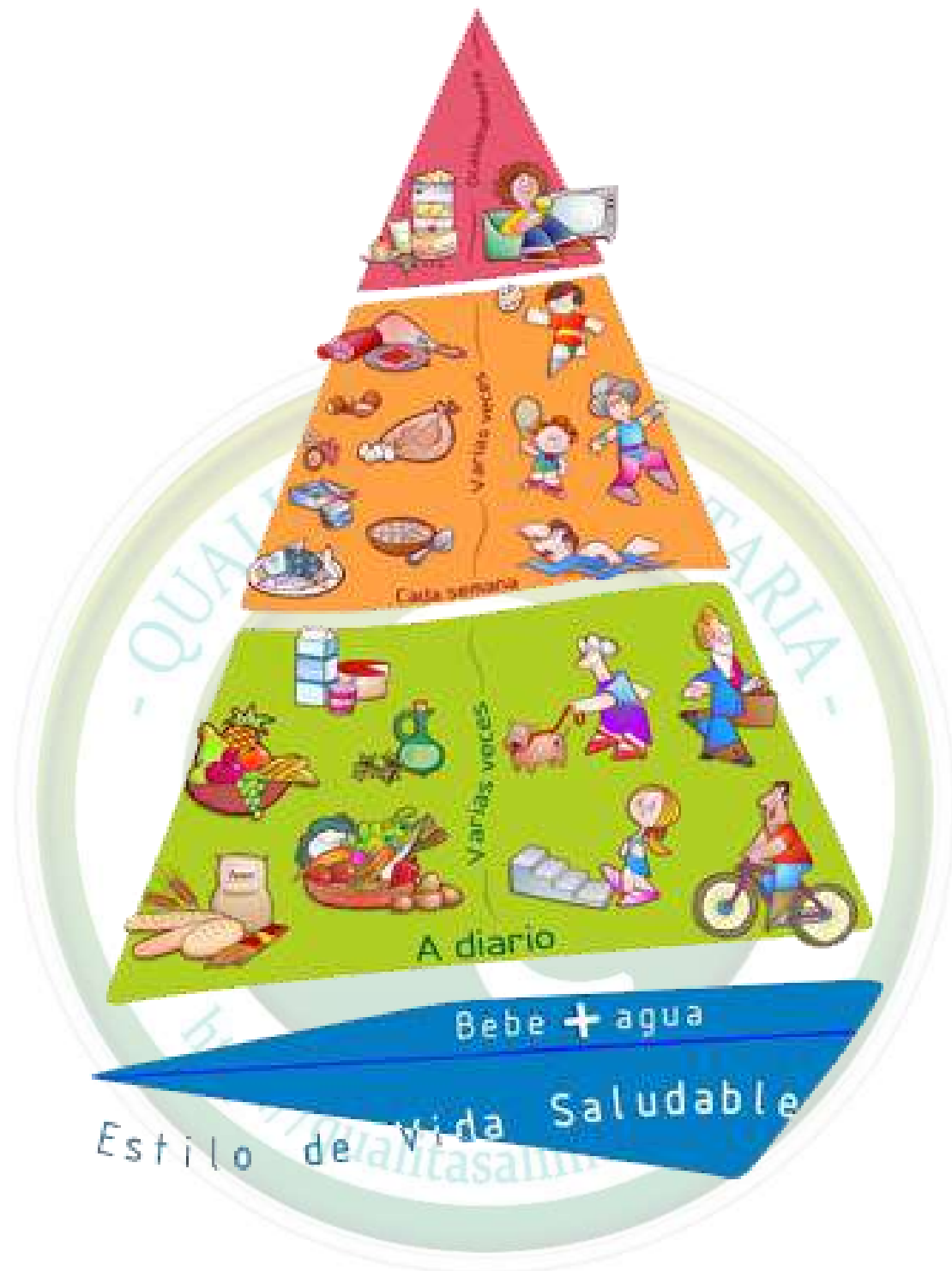
Pirámide NAOS 1